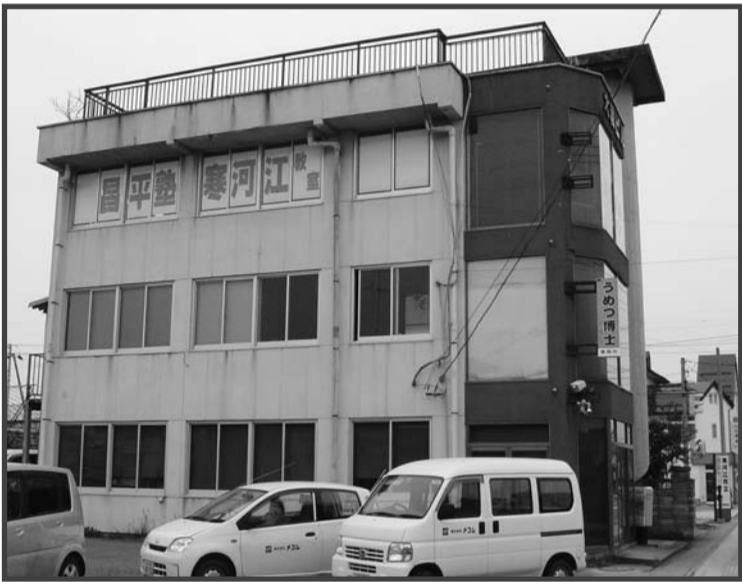
〔左写真が事務所全景 事務所は二階〕